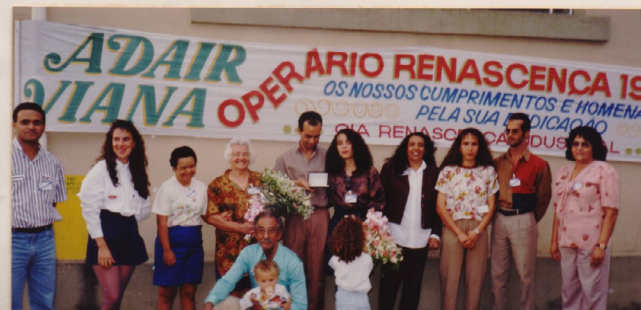
Com familiares, amigos e organizadores da Cam panha